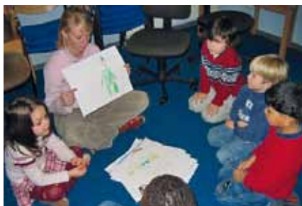
Ein dreitägiges Kinderprogramm mit erfahrenen Pädagogen gehört zum LAKO-Programm.

Die Wirtschaftsjuvenoren Südwestfalen sind ein Zusammenschluss junger Selbstständiger und Führungskräfte in der Region Siegen-Wittgenstein und Olpe. Gegründet Anfang 1950 als „Kreis Junger Unternehmer“ im Verband der Siegerländer Metallindustriellen. Mitgliedsalter: bis zu 40 Jahre. Auf Bundesebene zusammengefasst als Wirtschaftsjuvenoren Deutschlands (WJD). 1978 und 2000 fanden die Landeskonferenzen schon einmal in Siegen statt.