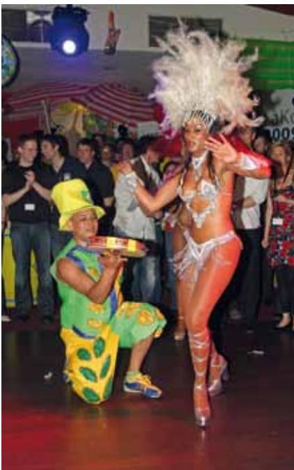
Ab in den Süden – unter diesem Motto laden die Wirtschaftsjunioren nach Siegen ein.

Seit 1950 sind so die Wirtschaftsjunioren Südwestfalen ein wichtiger Akteur der regionalen Wirtschaft. Und passend zum 60. Geburtstag in diesem Jahr haben sie sich mit der Ausrichtung